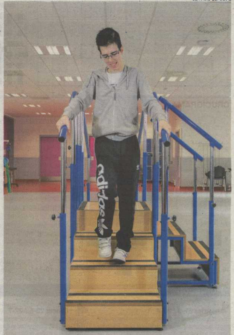
► Usuario del programa de Autonomía Personal.

En las sesiones, tanto individuales como grupales, se trabaja la masa muscular, la respiración, la postura, el movimiento consciente, se reduce el dolor y se favorece la realización de actividades cotidianas. ≡